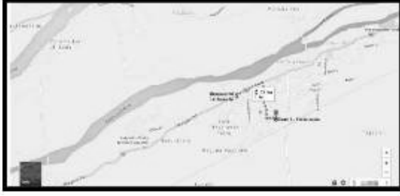
(1) Google Map of Polling Station Location

110. P.U.Ele. School East facing building, Pandaravadai 614204 110. ஊராட்சி ஒன்றியதொடக்கப்பள்ளி பிழக்கு பார்த்த கட்டிடம் ,பண்டாரவாடை,614204