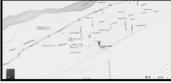
(1) Google Map of Polling Station Location

III. அராட்சி ஒன்றிய நடுநிலைப்பள்ளிநடுகட்டிடம் து.பிநகர் அறைஎண் 2 ,பண்டாரவாடை,614204