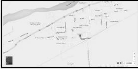
(1) Google Map of Polling Station Location

112. ஊராட்சி ஒன்றிய நடுநிலைப்பள்ளி மேற்குகட்டிடம் சூபிநகர் அறைஎண் 4 பண்டாரவாடை.614204