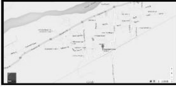
(1) Google Map of Polling Station Location

113. Panchayat Union Middle School building No 3 western building Soofi Nagar, Pandaravadal 614204 113. ஊராட்சி ஒன்றிய நடுநிலைப்பள்ளி து.பிநகர் அறைஎண் 3 ,பண்டாரவாடை.614204